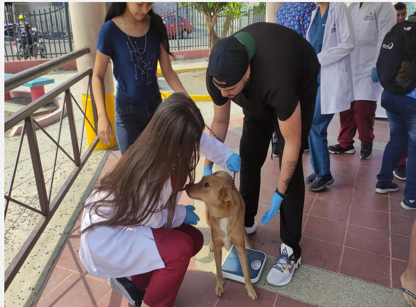
B. Campaña de desparasitación de mascotas de la Cooperativa Virgen del Cisne del Cerro San Eduardo dentro del proyecto de vinculación Cuidado Responsable.