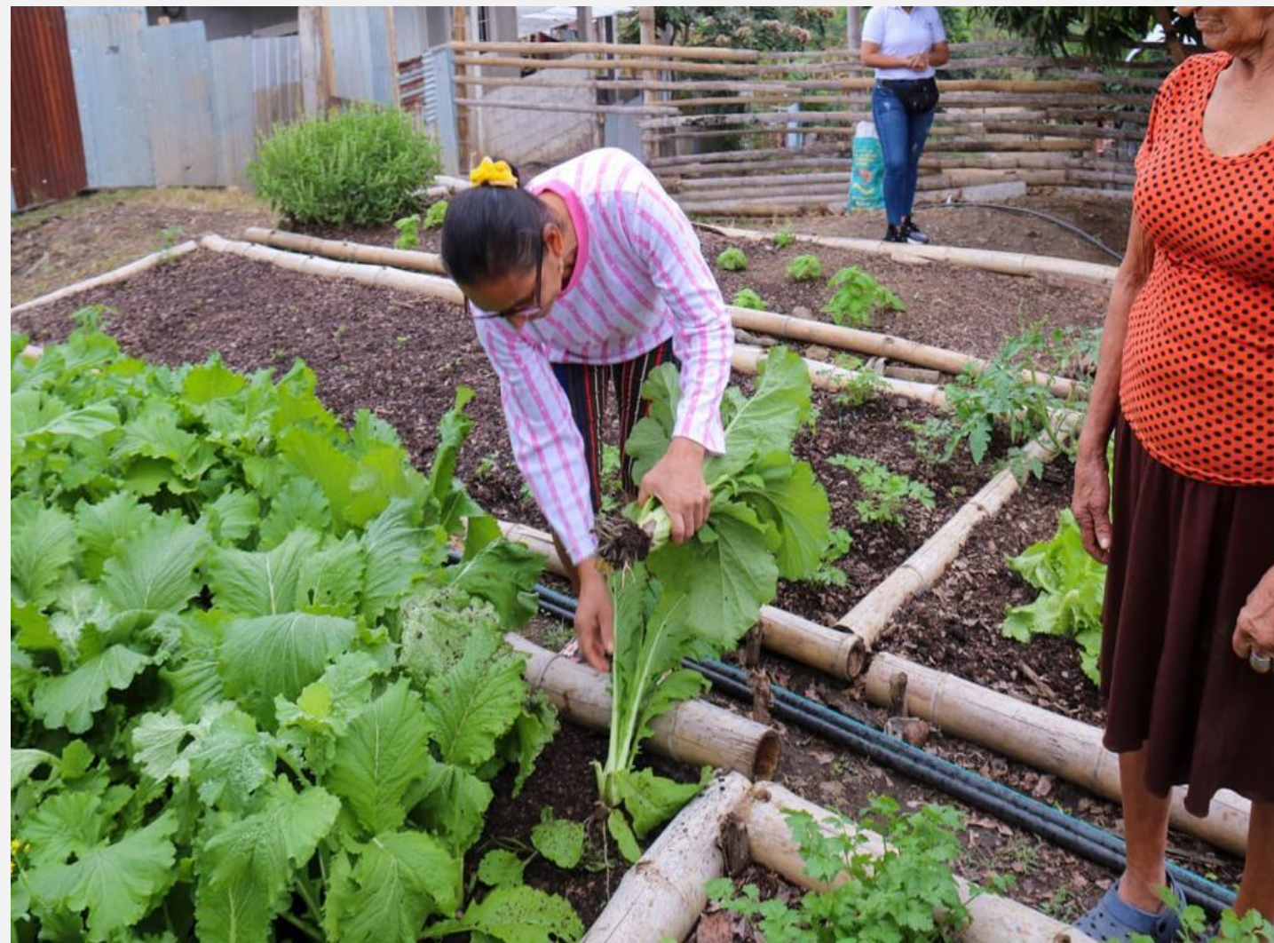
A. Realizando actividades de cultivo dentro del proyecto de vinculación Huertos Urbanos.