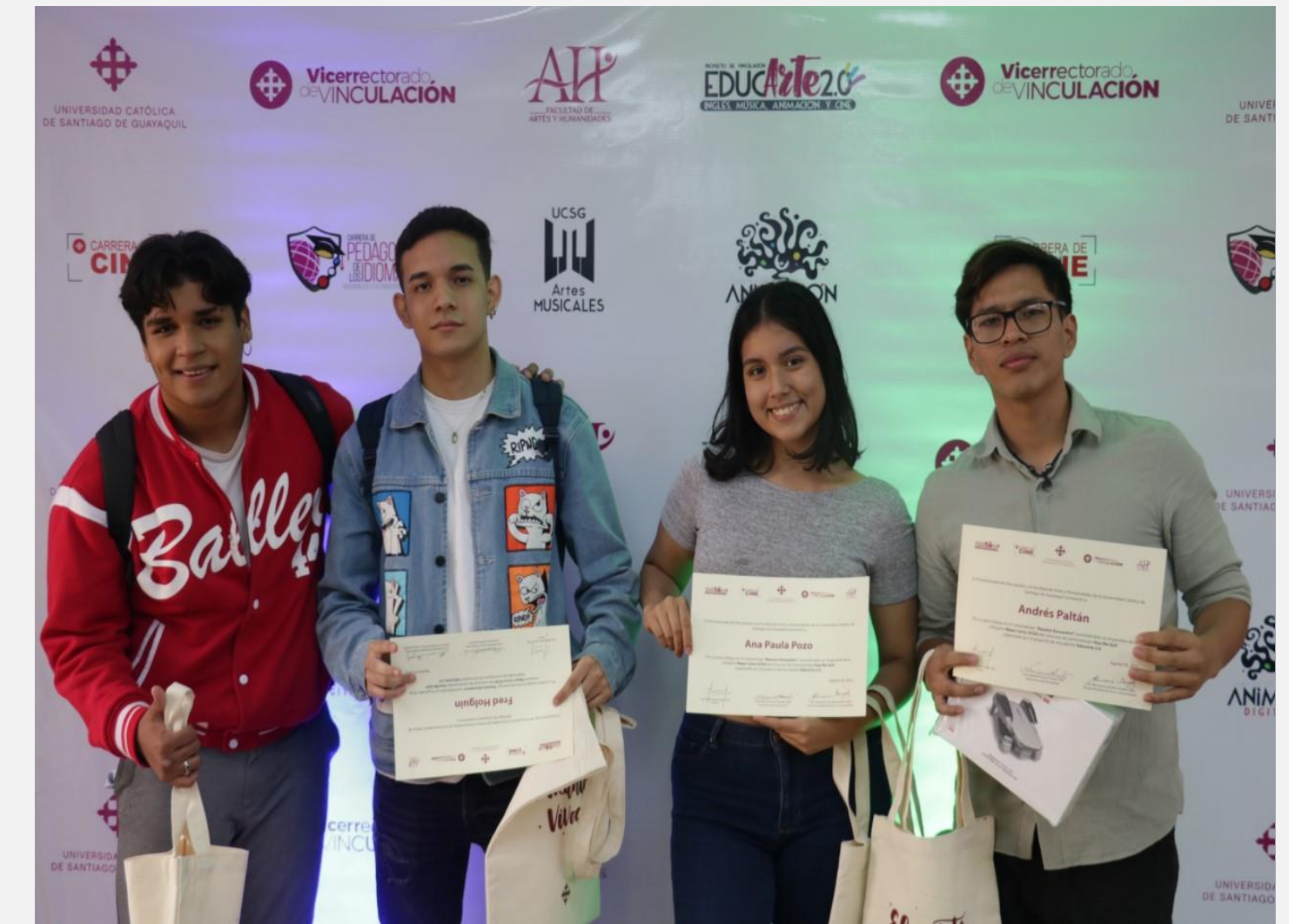
C. Premiación de Mejor Cortometraje en el evento de inauguración de EDUCARTE 2.0.