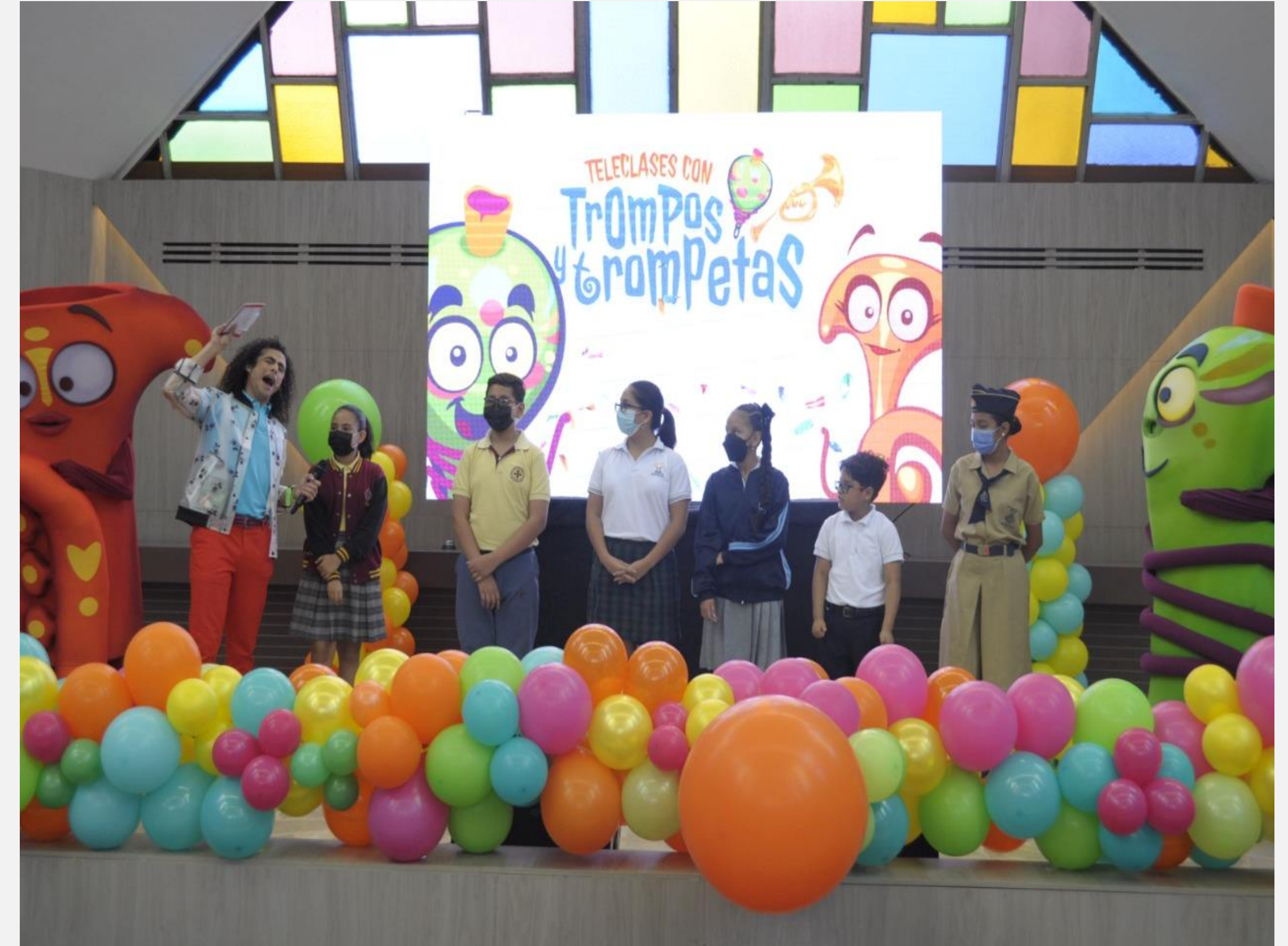
Evento de inauguración del proyecto de vinculación Teleclases con Trompos y Trompetas.