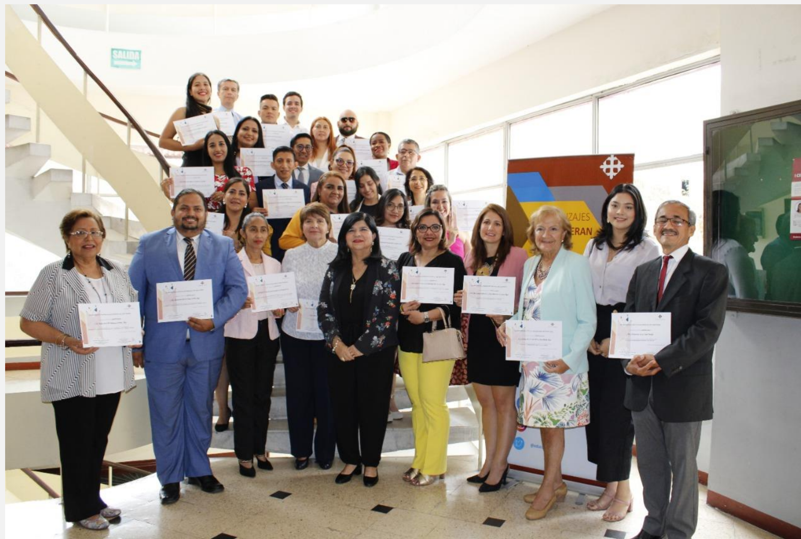
Ceremonia de clausura Diplomados: Inclusión Educativa, Gestión Directiva para Organizaciones Educativas y Ordenamiento Territorial.