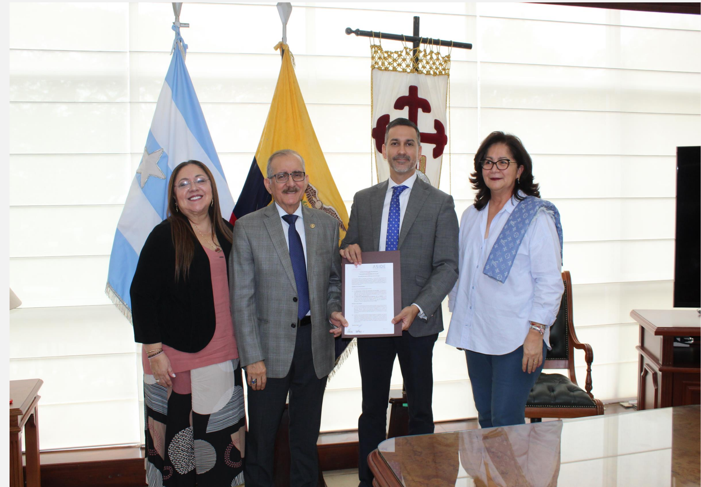
Firma de Convenio de Cooperación Interinstitucional con ASIDE.